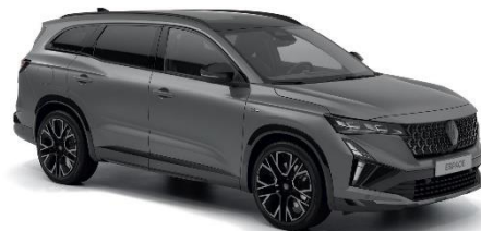
mat siva schiste (3)