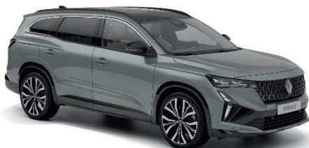
siva baltique (1)