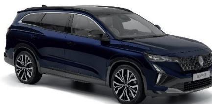
modra nocturne (2)