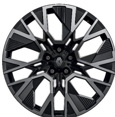
platišča iz lahke litine 51 cm (20") Altitude