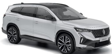
perla bela (2)