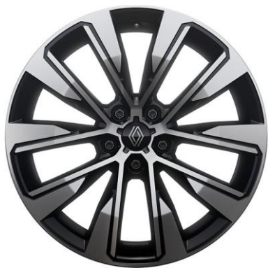
platišča iz lahke litine 48 cm (19") Komah