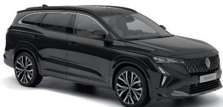
biserno črna (1)