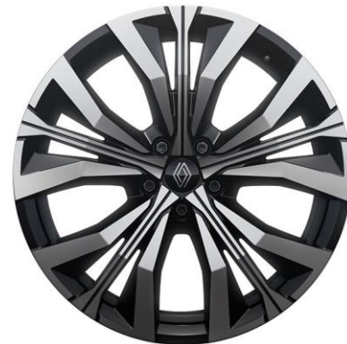
platišča iz lahke litine 51 cm (20") Effie